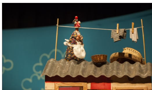
A veciña rosmona.