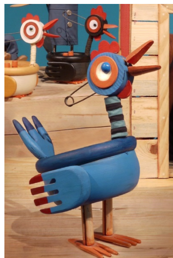
A Galiña Azul.