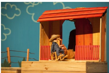
O veciño durmiñón.